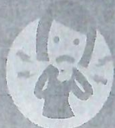
Inflamação da garganta