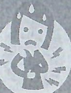
Dores no corpo